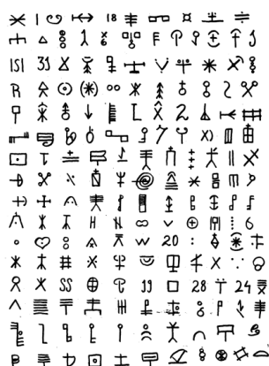
Gráfico 6: Simbología de redolins

El Palmar es un pueblo de pescadores, ellos son los creadores de la cultura y los más interesados en reivindicar sus tradiciones. La riqueza cultural de la comunidad se refleja en sus formas de hablar, las creencias, fiestas, la comida y el arte. La mayor parte de los habitantes de El Palmar hablan valenciano. Tanto en temas de agricultura como en pesca tienen un léxico propio y único, cuentan con una amplia simbología, códigos, nombres de artes y de los redolins. El mote, el apodo y la broma son formas de interacción entre los miembros de una comunidad, esta muestra una relación de confianza y proximidad. Muchas veces el mote es personal o familiar y se traslada de generación en generación. Las expresiones culturales a través de los sonetos, refranes, proverbios son parte de la cultura popular de los pueblos, expresiones culturales que hoy se están perdiendo.