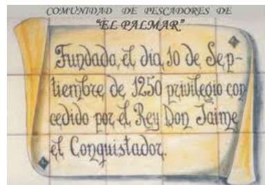
Gráfico 2: Fachada Comunidad de Pescadores

Sobre la fachada de la Comunidad de pescadores de El Palmar reposa una placa de cerámica que dice: "Fundada el día 10 de Septiembre de 1250 privilegio concedido por el Rey Don Jaime el Conquistador". Esta frase resume como se inicia la pesca en El Palmar.