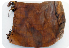
Bolsa antigua donde se introducían los redolins durante los siglos XIX y XX.

La pesca en el lago funciona bajo pedido, desde la dirección de la Comunidad de Pescadores se realiza el reparto asignado. Se comunica a los cuatro grupos de pesca que saldrán a faenar la cantidad solicitada por el comprador. Los grupos salen a pescar según por orden y los beneficios se distribuyen entre todos los pescadores equitativamente.