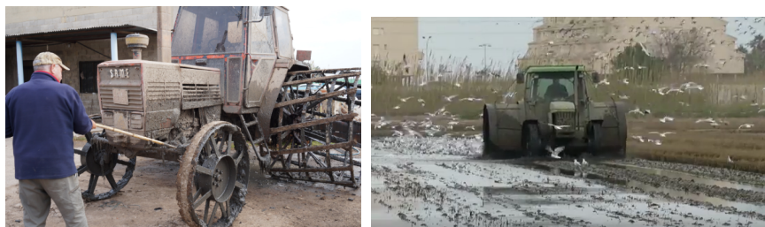
Gráfico 3: Agricultor en épocas de fangueado de arroz

La pesca al dejar de ser una actividad rentable fue remplazada por el cultivo de arroz, algunos pescadores complementaron la actividad con la agricultura. Aquí se evidencia una dicotomía de intereses de ciertos pescadores entre las dos actividades. Por un lado, está presente el interés de mejorar la calidad de las aguas del lago y con ellas la pesca, y por otro lado, el interés sobre el rendimiento de los campos de arroz que requieren el uso de agroquímicos pero provocan la contaminación del lago. La Comunidad de Pescadores ha sabido representar los intereses de los pescadores frente a la administración consiguiendo que las condiciones del lago empiecen a mejorar. Esto se logró a través de acuerdos colectivos y con la introducción de nuevos controles y de regulaciones.