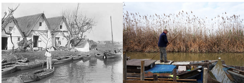
Gráfico 4: Barracas en la albufera 1930 vs Pesca en las golas de la Albufera 2017

El desarrollo local tiene como objetivo principal el crecimiento económico equitativo a largo plazo considerando el valor social y cultural de la zona. Sus acciones están encaminadas a mejorar la calidad de vida de las personas, erradicar la pobreza, lograr una actividad económica sostenible, proteger los recursos naturales y fortalecer la cultura y tradiciones de la zona.