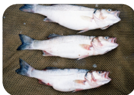
Lubina o «llobarro»