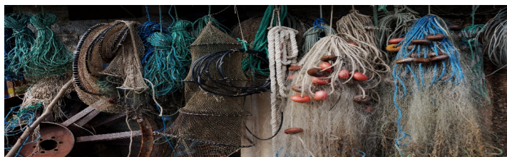
Gráfico 5: Aparejos de pesca artesanal.

El Palmar es un pueblo de pescadores, ellos son los creadores de la cultura y los más interesados en reivindicar sus tradiciones. La riqueza cultural de la comunidad se refleja en sus formas de hablar, las creencias, fiestas, la comida y el arte. La mayor parte de los habitantes de El Palmar hablan valenciano. Tanto en temas de agricultura como en pesca tienen un léxico propio y único, cuentan con una amplia simbología, códigos, nombres de artes y de los redolins. El mote, el apodo y la broma son formas de interacción entre los miembros de una comunidad, esta muestra una relación de confianza y proximidad. Muchas veces el mote es personal o familiar y se traslada de generación en generación. Las expresiones culturales a través de los sonetos, refranes, proverbios son parte de la cultura popular de los pueblos, expresiones culturales que hoy se están perdiendo.