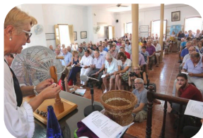
Sorteo Anual de redolins

El sorteo anual de los redolins es un ejemplo de gestión comunal del recurso, considerado entre los pescadores como un sistema justo y que forma parte de su tradición pescadora. Desde su permanencia en Valencia la Comunidad de Pescadores realizaba este sorteo que tenía lugar en la parroquia de San Andrés de Ruzafa, hoy en día se realiza el segundo domingo de julio de cada año en las instalaciones de la Comunidad de Pescadores de El Palmar. El pescador ya conoce la capacidad de pesca que tendrá durante el año dependiendo del punto fijo que haya elegido el pescador en el sorteo. Los primeros pescadores sorteados seleccionan los puntos de pesca o redolins que mejor les parezca.